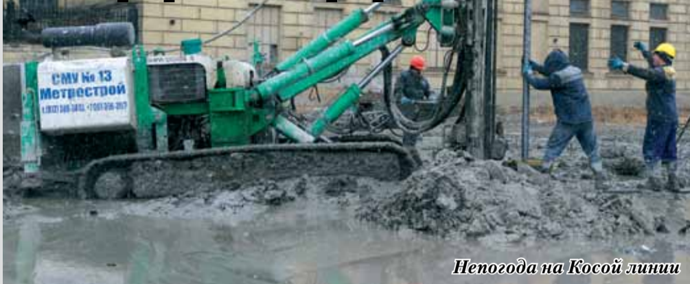
Непогода на Косой линии

Оживленный перекресток Большого проспекта Васильевского острова, 22-23 и Косой линии перекрыт и перерыт. Но василеостровцы не ропщут, зная о том, что открытие станции «Горный институт» на этом перекрестке значительно улучшит сообщение с центром города.