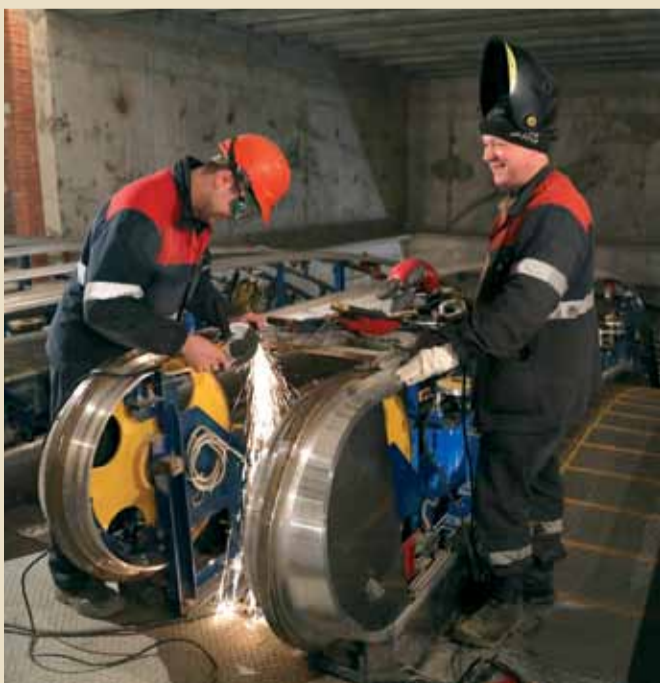
Последний штрих. К сдаче готовы!