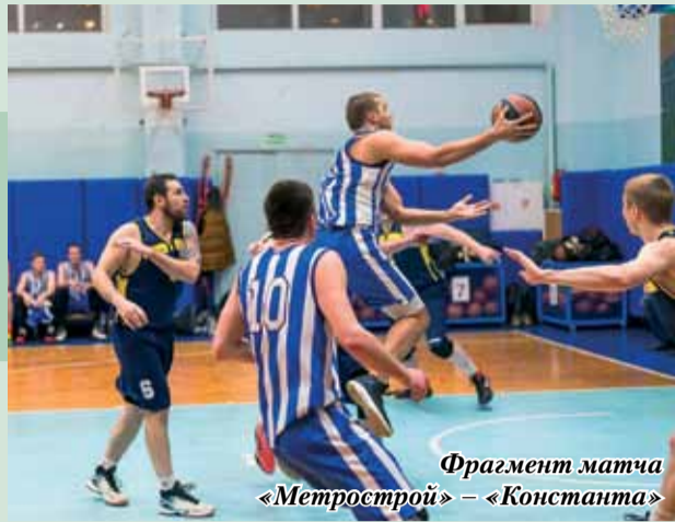
Фрагмент матча «Метрострой» – «Константа»