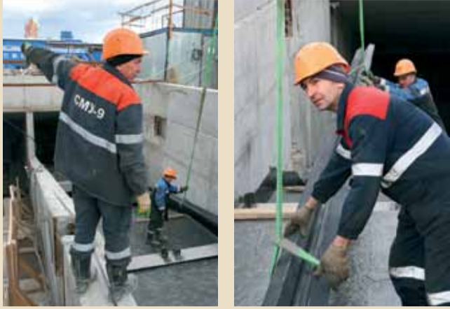
На фундамент устанавливаются первые прогоны траволаторов. Командует – «Девятка»!