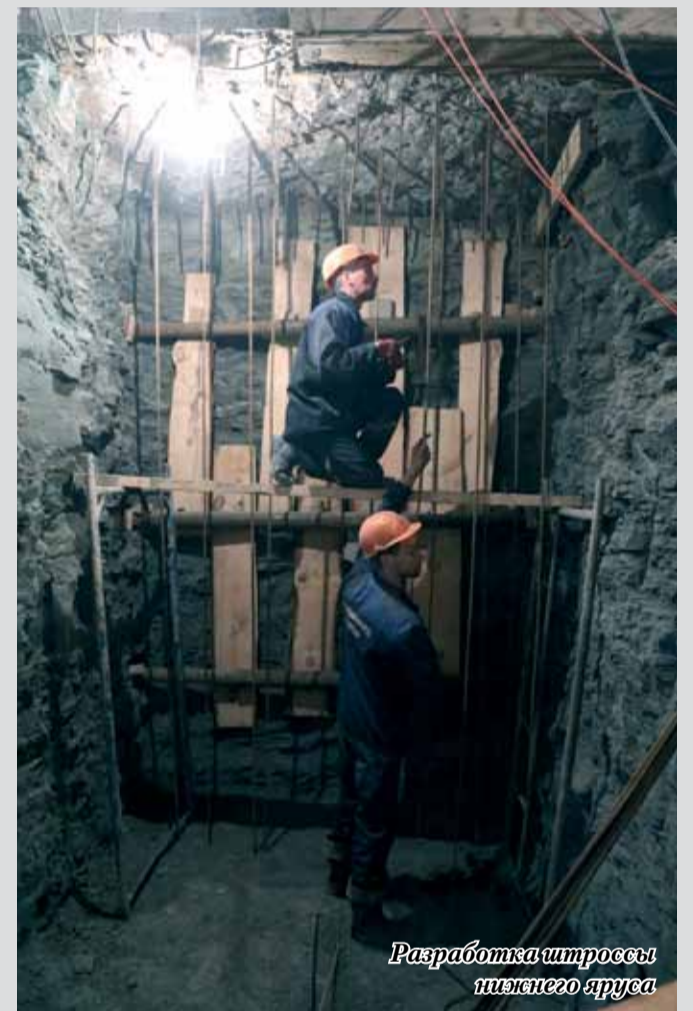
Разработка штроссы нижнего яруса

Сейчас бригады проходчиков поярусно сооружают в нашей камере стены. Разработка породы ведется штроссами. Штроссы первого яруса на высоту почти четыре метра полностью разработаны и забетонированы. В шахматном порядке идет разработка штросс нижнего яруса – из 26 разработано шесть. Думаю, что к концу мая нижний ярус будет забетонирован.