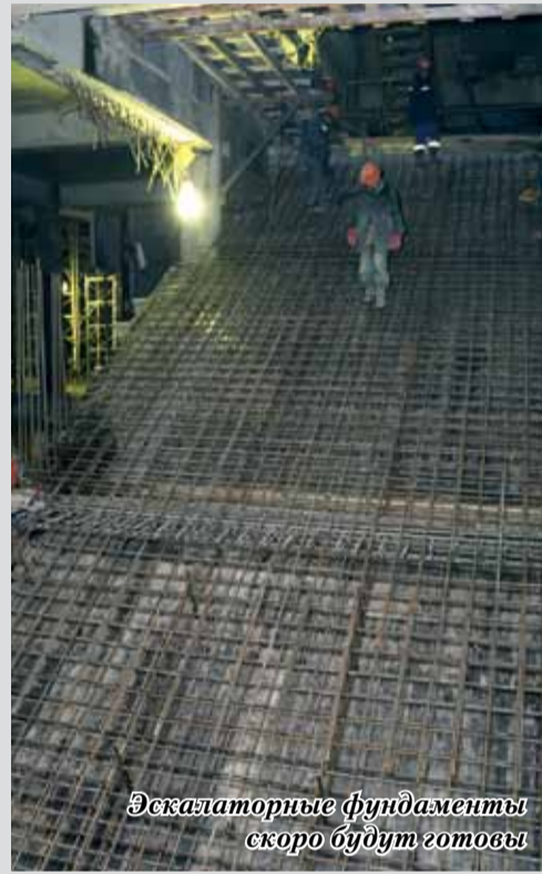
Эскалаторные фундаменты скоро будут готовы

Облачение станции в бетон происходит в строгой последовательности. Сначала «крышка»: после прогона щита днище бетонировается, заливается стяжка, армируется центральная, самая мощная часть плиты основания, все это сверху накрывается бетонной шапкой. Или «крышкой», как здесь