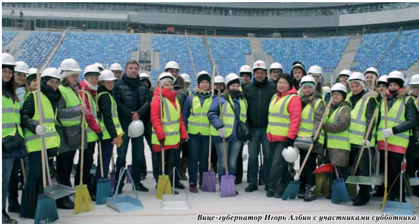
Вице-губернатор Игорь Албин с участниками субботника