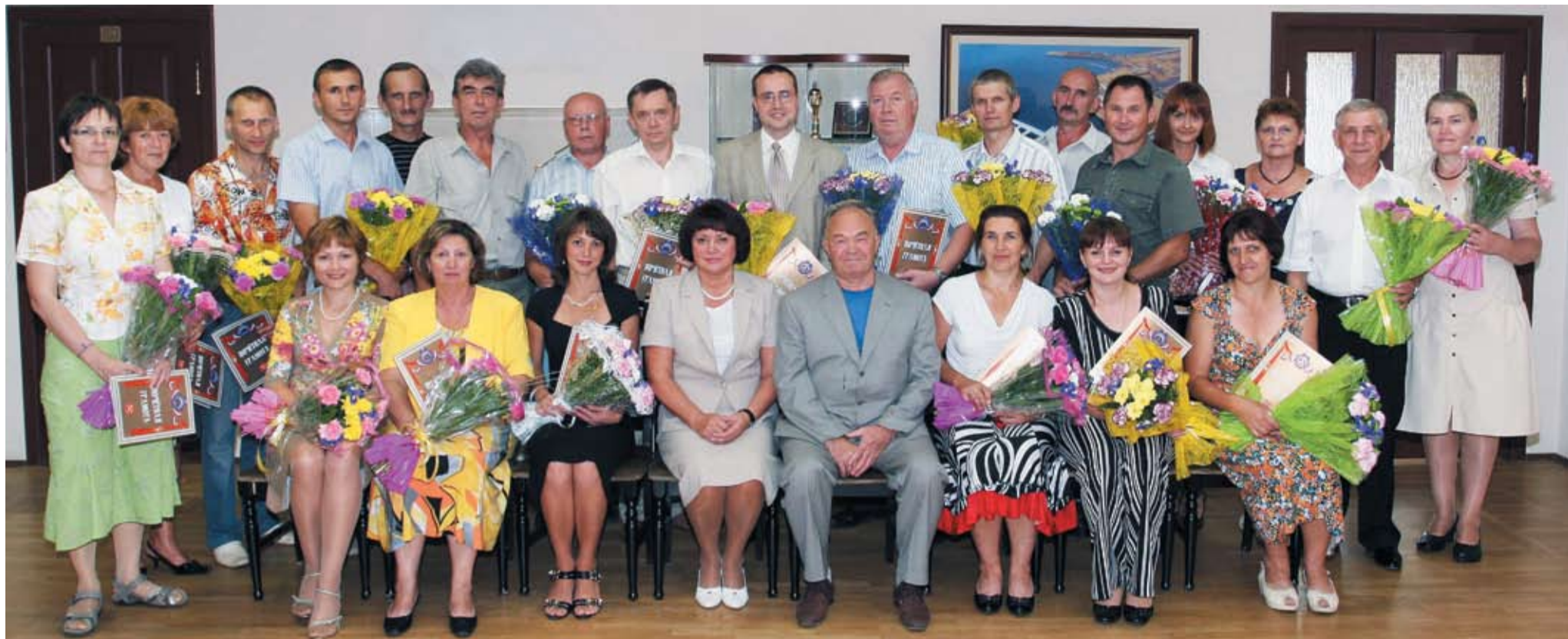
Работники, награжденные Грамотами ОАО «Метрострой» ко дню Строителя-2010